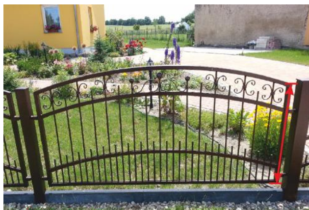
Höhe des Gartenzaun (außen gemessen)

Im Online-Konfigurator geben Sie dann die gemessene Gesamtlänge des Gartenzauns inklusive Pfosten sowie die Anzahl der möglichen Eckpfosten ein. Die Maße der Pfosten betragen 80x80 mm. Die benötigte Anzahl der Pfosten wird von uns automatisch berechnet. Die Höhe des Gartenzauns messen Sie an den äußeren Seiten des Zauns. Die Maßstaffelung für die Bogenmaße bei Gartenzäunen mit Ober- oder Unterbogen können Sie aus der folgenden Tabelle entnehmen. Der tatsächliche Höhenunterschied zwischen des Gartenzauns von außen bis zur Bogenmitte wird von uns automatisch berechnet.