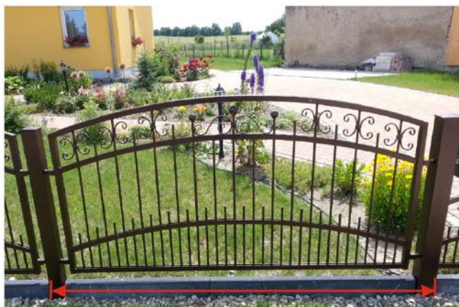
Länge Gartenzaun inklusive Pfosten (Maße Pfosten: 80x80 mm)

Wenn Ihre Skizze fertig ist, stecken Sie sich die Endpunkte Ihres zukünftigen Gartenzauns z.B. mit Steinen oder Holzleisten ab. Anschließend nehmen Sie sich ein Maßband oder einen Zollstock und messen die Abstände der abgesteckten Punkte und notieren Sie sich diese.