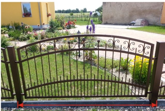
Länge Gartenzaun inklusive Pfosten (Maße Pfosten: 80x80 mm)

Wenn Ihre Skizze fertig ist, stecken Sie sich die Endpunkte Ihres zukünftigen Gartenzauns z.B. mit Steinen oder Holzleisten ab. Anschließend nehmen Sie sich ein Maßband oder einen Zollstock und messen die Abstände der abgesteckten Punkte und notieren Sie sich diese.