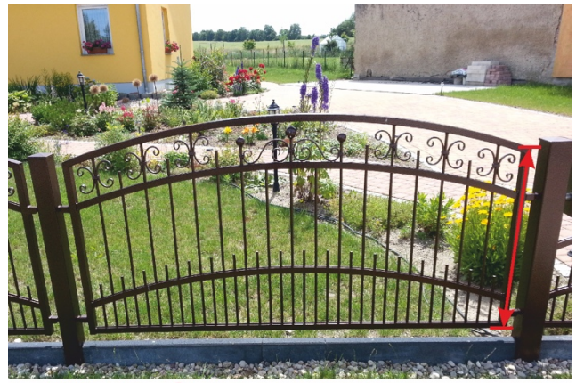
Höhe des Gartenzaun (außen gemessen)

Im Online-Konfigurator geben Sie dann die gemessene Gesamtlänge des Gartenzauns inklusive Pfosten sowie die Anzahl der möglichen Eckpfosten ein. Die Maße der Pfosten betragen 80x80 mm. Die benötigte Anzahl der Pfosten wird von uns automatisch berechnet. Die Höhe des Gartenzauns messen Sie an den äußeren Seiten des Zauns. Die Maßstaffelung für die Bogenmaße bei Gartenzäunen mit Ober- oder Unterbogen können Sie aus der folgenden Tabelle entnehmen. Der tatsächliche Höhenunterschied zwischen des Gartenzauns von außen bis zur Bogenmitte wird von uns automatisch berechnet.